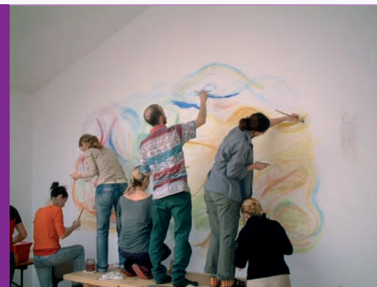
malba společné vize na stěnu