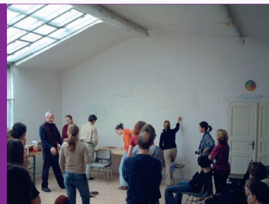
„tak co nás dneska čeká“

Centrum inovativního vzdělávání pružně reaguje na aktuální společenské problémy, které se promítají do školství. Projekt je zaměřen na rozšíření nabídky prakticky orientované výuky formou workshopů vedených předními odborníky z celé České republiky a probíhá pod záštitou ESF a MŠMT ČR.