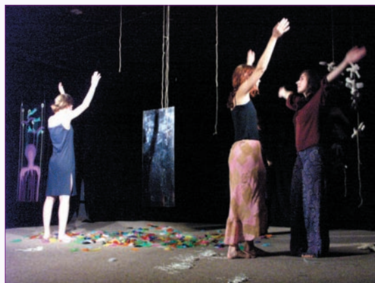
lidé tvoří živý společný obraz

Studenti UP si mohou navíc zapsat blok šesti workshopů jako volitelný předmět ohodnocený třemi kreditními body.