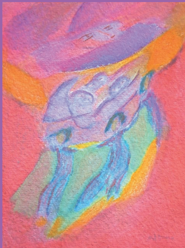
Roztančená duše, Beppe Assenza (1974)

AKADEMIE SOCIÁLNÍHO UMĚNÍ TABOR, PRAHA P-CENTRUM, OLOMOUC