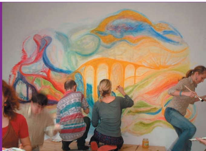
práce na workshopu Vás „dostane“

Detailní informace o jednotlivých workshopech jsou ke stažení na webových stránkách projektu, kde budou rovněž k dispozici on-line konzultace se zúčastněnými odborníky, diskuzní fóra a odborné materiály.